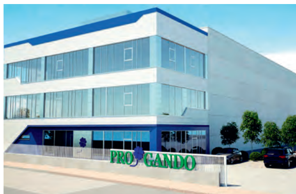
Figura 4. Proyecto de nave para almacenamiento y envasado de fertilizantes en el polígono de Morás (Arteixo)

El objetivo de nuestros técnicos es ofrecer un asesoramiento, tanto ganadero como agronómico, que permita mejorar las producciones y calidades forrajeras, así como ayudar en la toma de decisiones a nuestros clientes. Dentro del asesoramiento consideramos clave: