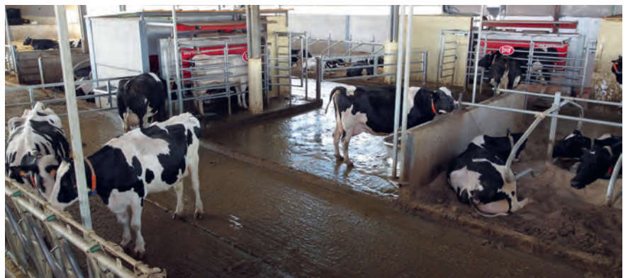
Para las vacas en lactación, se combina la alimentación en el pesebre con el pienso de los robots de ordeño

transición. “En esta granja, la incidencia de retenciones o desplazamientos es a día de hoy prácticamente mínima. Esto nos ha permitido reducir casi a cero la tasa de eliminación voluntaria en los primeros sesenta días por problemas de transición y que el ganadero pierda parte del miedo al secado, a la transición y a la búsqueda de más partos”, relata Iglesias.