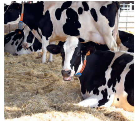
Utilizan el Plan Prelacto para las secas