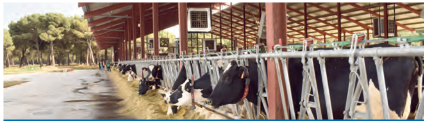
Si hay esporas de clostridio en los ensilados, estas son ingeridas por la vaca con la ración y pasan el tracto digestivo para ser eliminadas por las heces

punto de vista de la calidad de la leche, si hay esporas de clostridio en los ensilados estas son ingeridas por la vaca con la ración y pasan el tracto digestivo para ser eliminadas por las heces. Si hay una contaminación fecal de las ubres (Burtscher, 2023), las esporas pueden entrar en la leche y luego en el queso provocar hinchazones tardías.