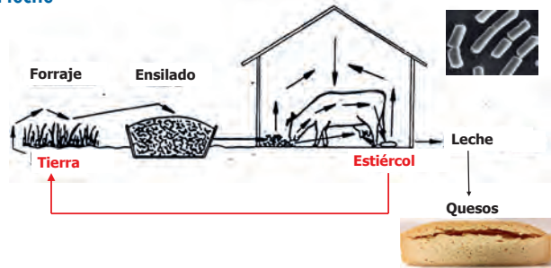
Figura 2. Contaminación en el silo: presencia de bacterias y hongos (mohos y levaduras)