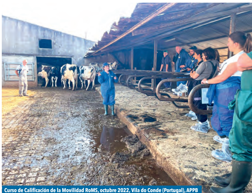
Curso de Calificación de la Movilidad RoMS, octubre 2022, Vila do Conde (Portugal), APPB

► CONTAR CON HERRAMIENTAS OBJETIVAS Y EFICACES QUE DEMUESTREN QUE LAS GRANJAS GOZAN DE LOS MÁS ALTOS NIVELES DE BIENESTAR PARA SU GANADO ES CRUCIAL PARA MANTENER LOS CONTRATOS CON LA INDUSTRIA