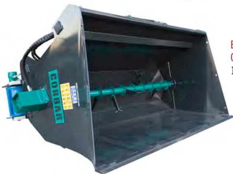
ENCAMADORA DE CUBÍCULOS DE 1.7 M 2 Y 2.1M 2