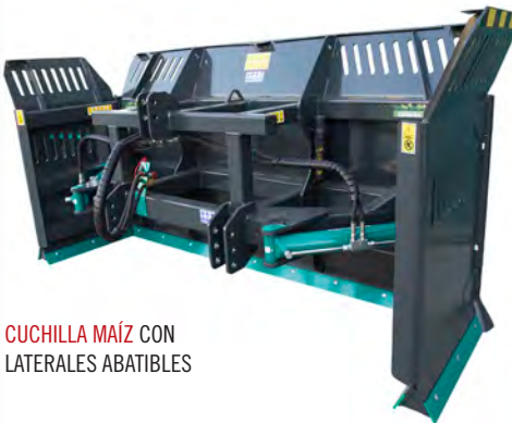
CUCHILLA MAÍZ CON LATERALES ABATIBLES