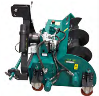
ARRIMADOR DE RACIÓN CON CEPILLO BARREDOR