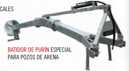
BATIDOR DE PURÍN ESPECIAL PARA POZOS DE ARENA