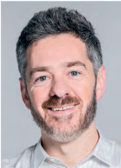
Albert Poch www.rediabogados.com

► EL PRECIO DE LA LECHE SIGUE SIN RECUPERARSE Y LA INDUSTRIA LÁCTEA [...] ACUMULA UN PODER DE NEGOCIACIÓN CADA VEZ MAYOR FRENTE AL GANADERO