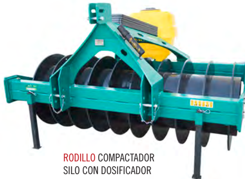
RODILLO COMPACTADOR SILO CON DOSIFICADOR PARA CONSERVANTE