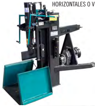
ASTILLADORAS HIDRÁULICAS DE 12 A 25 TONELADAS, HORIZONTALES O VERTICALES