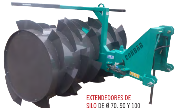
EXTENDEDORES DE SILO DE Ø 70, 90 Y 100