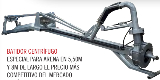
BATIDOR CENTRÍFUGO ESPECIAL PARA ARENA EN 5,50M Y 8M DE LARGO EL PRECIO MÁS COMPETITIVO DEL MERCADO PRUÉBALO SIN COMPROMISO