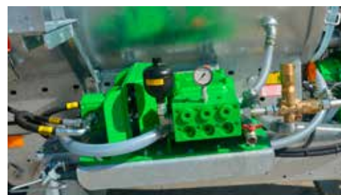
Bomba de alta presión

Numerosas opciones son posibles como un eje seguidor o direccional forzado, un frenado neumático, una advertencia sonora de nivel de agua alta presión o también un cofre de almacenamiento.