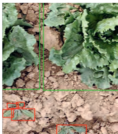
La reciente incorporación del Robodog (Syngenta) ofrece una visión única sobre la salud de las plantas y mejora el conocimiento de lo que sucede en el campo en tiempo real

► DESDE EL PUNTO DE LA ESTABILIDAD Y SOSTENIBILIDAD SE ESTÁN DESARROLLANDO Y AFINANDO CADA VEZ MÁS MODELOS PREDICTIVOS DE RENDIMIENTO, DETECCIÓN TEMPRANA DE PLAGAS Y ENFERMEDADES